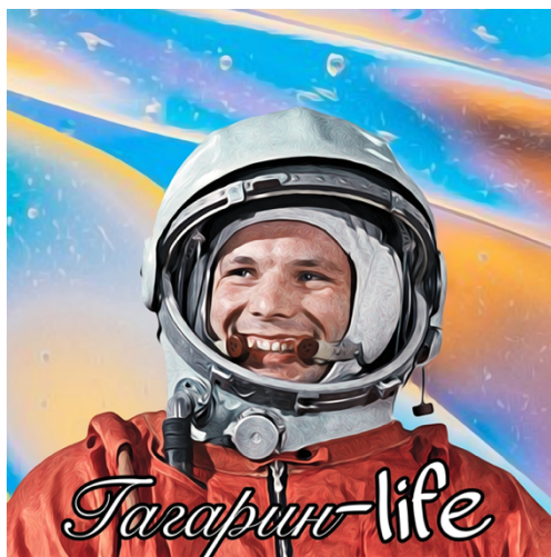
Рис. 1. Название