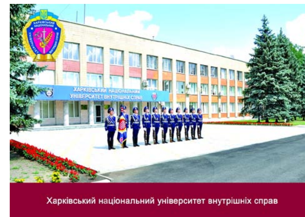
Харківський національний університет внутрішніх справ